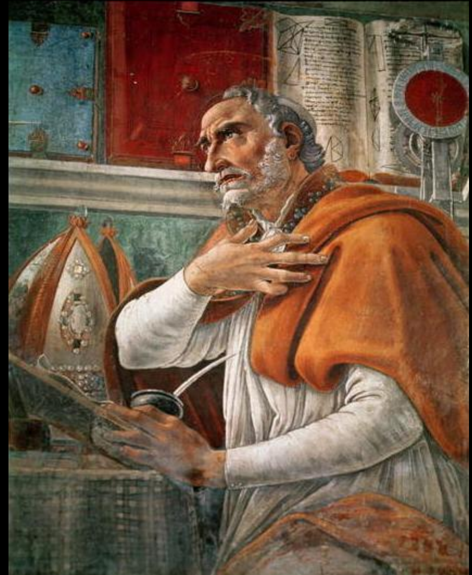
Augustine of Hippo

羅13:13 行事為人要端正，好像行在白晝。不可荒宴醉酒，不可好色邪蕩，不可爭競嫉妒；14 總要披戴主耶穌基督，不要為肉體安排，去放縱私慾。